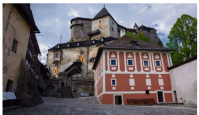
Zamek Orawski.

Obie wyprawy zostały zorganizowane w ramach projektu „Oświęcim – Wawrećka z dziedzictwem w przyszłość” przygotowanego przez Ośrodek Kultury, Sportu i Rekreacji oraz samorząd Wawrećki. Jest to wieś i zarazem gmina w północnej Słowacji, z którą od siedmiu lat łączy nas partnerska współpraca.