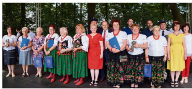
Przedstawiciele Zasłużonych dla Gminy Oświęcim organizacji.