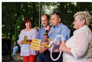
Klucz w rękach mieszkańców Dworów Drugich.