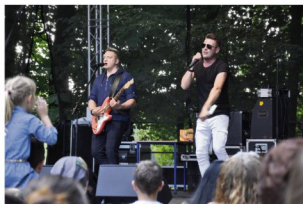
Ketchup i Sylwek, czyli Power Play.