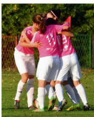
Po długich trzech latach awans Iskierki z Brzezinki mają wreszcie drugą ligę!