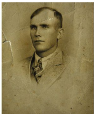
Tomasz Waliczek

Pochodził z Pław. Przed wojną pracował na kolei. Zgodnie z rozkazem zapisał się do Armii Andersa.