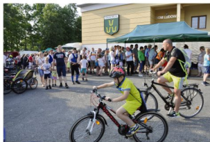
Uczestnicy Rajdu "Poznajemy Gminę".