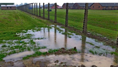
Podtopienia w maju zagroziły również terenom byłego obozu Birkenau.

Tylko w ciągu pięciu dni 180 ratowników z wszystkich jednostek OSP w naszej gminie ruszyło 29 razy do interwencji, akcji transportujących czasem nawet kilkanaście godzin. Łącznie było ich grubo ponad 800 – tyle czasu poświęcił strażacy z gminy Oświęcim na misje pomocy.