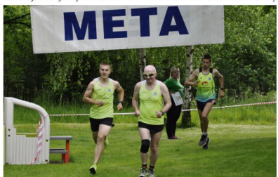
Zwycięzca i najstarszy biegacz na trasie.