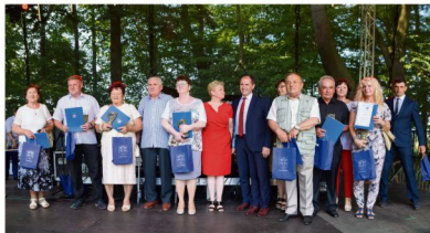
Zasłużeni dla Gminy Oświęcim mieszkańcy (lub reprezentujące ich osoby)