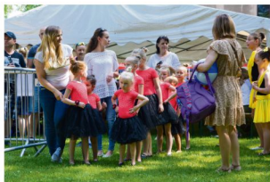
Tancerki eMotion Dance Academy.