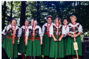
"Broszkowianki" – ostatnie chwile z Kluczem do Bram Gminy