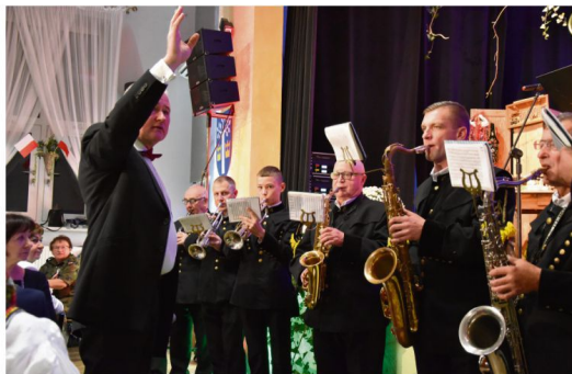
"I gra orkiestra z czterech estrad!...".