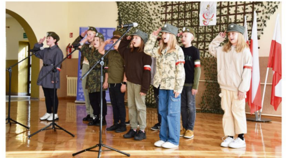
Fot. Robert Grabowski