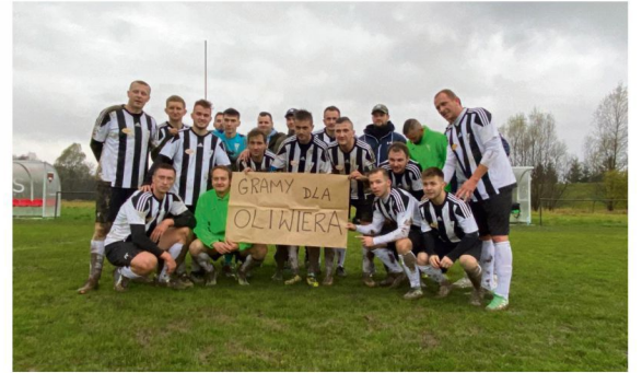
Na półmetku sezonu 2022/23 piłkarze Iskry Brzezinka zajmują trzecie miejsce ze stratą siedmiu punktów do lidera oświęcimskiej klasy A z Malca.