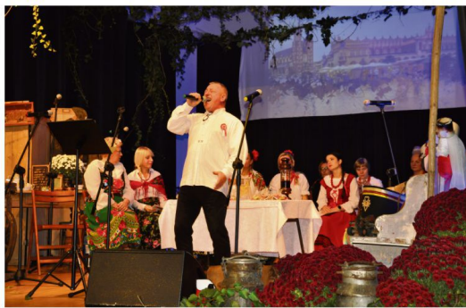
"Dziwny jest ten świat!...".