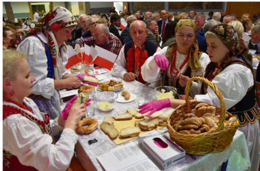
"Dałabym ci chleba z masłem...".