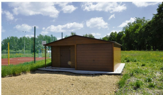
Wiele sołectw unowocześnia i rozwija tereny rekreacyjne. Na zdjęciach: altana w Stawach Monowskich i magazyn w Rajsku sfinansowane ze środków sołeckich.

+ 2 000,00 + 1 849,33, co w sumie daje uwidocznioną w drugiej kolumnie kwotę 30 460,51.