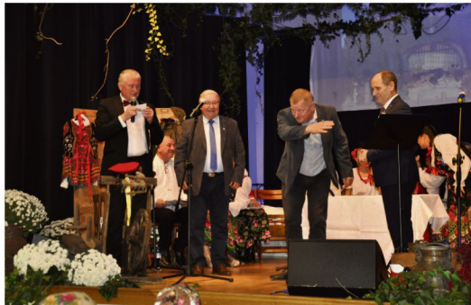
"Gra w kalambury.