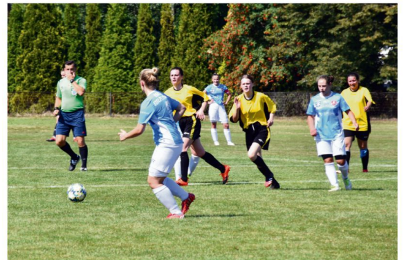
Piłkarki Iskry Brzezinka przystąpią do rundy rewanżowej z przedostatnią pozycją w trzeciej lidze. Na wiosnę ich nadrzędnym celem będzie obrona przed degradacją.

Po pierwszej rundzie w trzeciej lidze kobiecej (grupa IV) prowadzi Górnik II Łęczna (24 pkt), który ma punkt więcej od rezerw Resovii i dwa "oczka" przewagi nad duetem - Naprzód Sobolów, MOSiR Lubartów. Iskra jest przedostatnią (4 pkt) i wyprzedza tylko „czerwoną latarnię” z Bukowiny Tatrzańskiej. Rysy jesienią przegrały wszystkie swoje mecze.