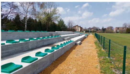
Ze środków sołectwa Brzezinka wyremontowane zostały trybuny na stadionie LKS Iskra.