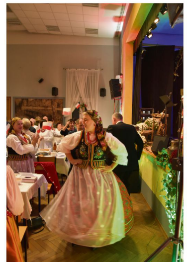
"Tańce, hulanku swawole!".