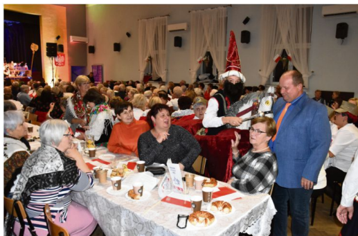
"Lajkoniku, laj, laj!".