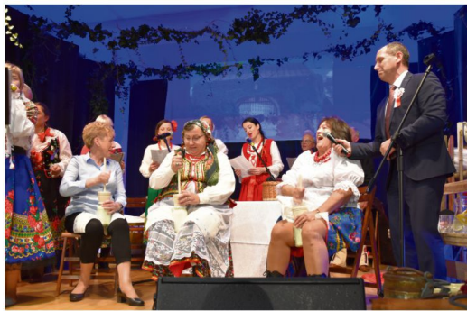
Ubijanie masła.