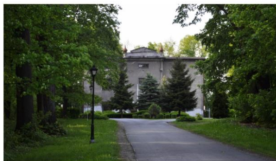
Szkoła Podstawowa w Porębie Wielkiej.