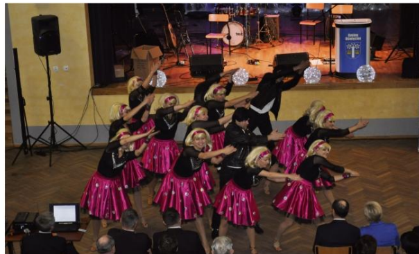
„Mamma Mia” wystąpiła na Spotkaniu Noworocznym 13 stycznia w Domu Ludowym w Grojcu.