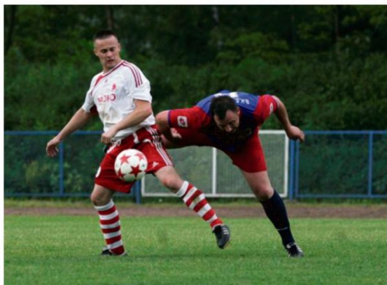
Piłkarscy kibice w naszym regionie muszą uzbroić się w cierpliwość. Runda rewanżowa w oświęcimskiej klasie A i B rozpocznie się dopiero końcem marca.

LKS Rajsko i włosienicki Sygnał z największymi szansami na promocję do wyższej ligi.