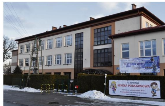
Obecne Gimnazjum Gminne nr 2 w Zaborzu zostanie przekształcone w ośmioklasową podstawówkę.