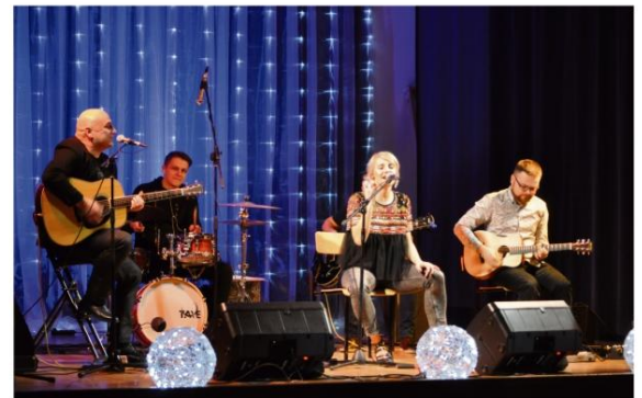
Nie-Bo na scenie Domu Ludowego w Grojcu.

cji. "Mamma Mia" co roku bierze udział w wielu regionalnych, krajowych i międzynarodowych konkursach. Jest aktualnym Mistrzem Polski, a także Mistrzem Świata w kategorii Choreography Dance Show Adults II. Swoimi występami członkowie Formacji pokazują, że na spełnienie marzeń nigdy nie jest za późno.