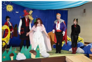
Włosienica. „Kot w Butach”.

6 grudnia był widziany w wielu miejscach. Magicznym i sobie tylko znanym sposobem odwiedził równocześnie wiele dzieci.