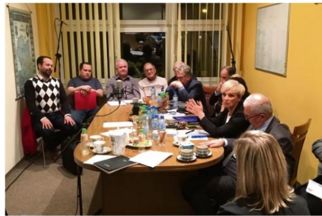
Pierwsze posiedzenie Zespołu 21.11.2016.