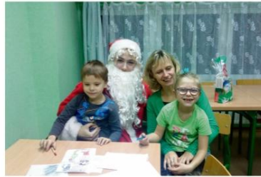
Harmęże.